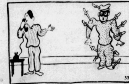
Kepadaian selamanya berguna.